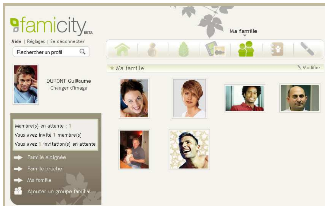
Aperçu de l’espace « Ma famille » sur www.famicity.com