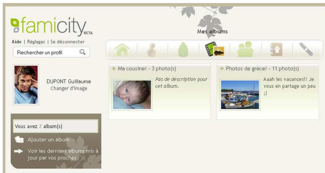
Aperçu des albums sur www.famicity.com

Chaque objet ajouté par un membre pourra faire l’objet de commentaires.