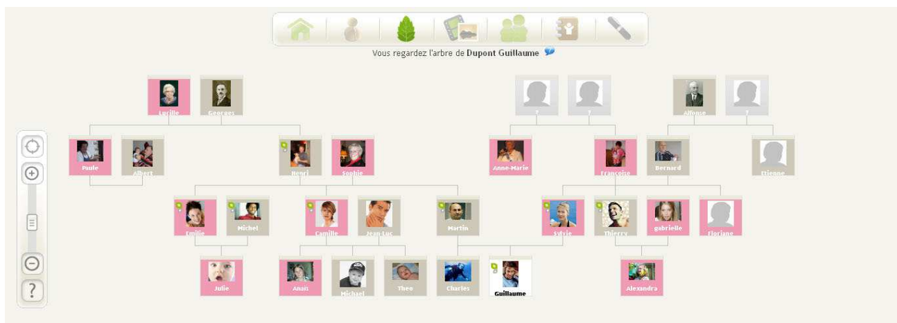
Arbre généalogique conçu sur www.famicity.com

Les créateurs sont des utilisateurs avisés et avertis sur les possibilités d’Internet. « Les informations concernant votre famille ou les photos de vos enfants ne doivent pas être mises à la disposition de tous les internautes » . Dans cette optique de respect de vie privée, Famicity n’ouvre pas d’accès public à votre profil, vos informations ou vos photos. Ainsi les internautes devront vous demander une autorisation pour accéder à vos informations.